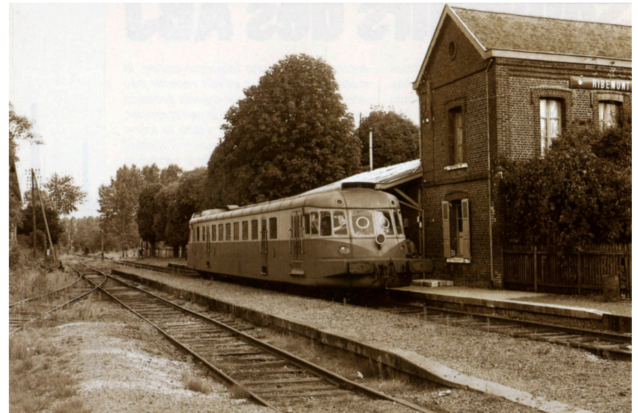
ABJ4 de la RTA en gare de Ribemont en 1955

Mise en service : 01/04/1949 Constructeur : Renault, usine de Billancourt Type constructeur : ABJ 4 Vitesse limite : 120 km/h Masse totale en ordre de marche : 31,5 t Masse totale en charge : 38 t Capacité de remorque : 20 t Rayon minimum d'inscription : 120 m Type moteur : Renault 517 J Nombre de cylindre : 12 en V à 60° Alésage : 140 mm Course : bielle 170 mm / biellette 179,5 mm Cylindrée : 32,3 L Puissance moteur : 220 kW (300 ch.) Vitesse maximale : 1 500 tr/min Puissance nominale de l'autorail : 193 kW Résistance de l'attelage : traction 24500 daN / compression 24500 daN Bogie porteur : Y 142 Masse : 4 t Bogie moteur : Y 143 Masse : 4,7 t Frein à air comprimé : automatique, modérable au serrage et au desserage Constructeur du frein : Jourdain Monneret Distributeur : 1, type JMR