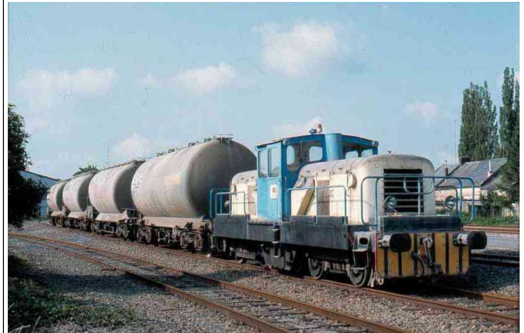
Manœuvre à Origny, photo F Dufetrelle.